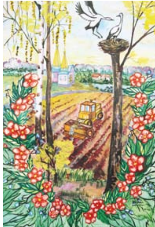
Клей Вікторія, 13 років с. Киликиїв, Славутський р-н, Хмельницька обл.