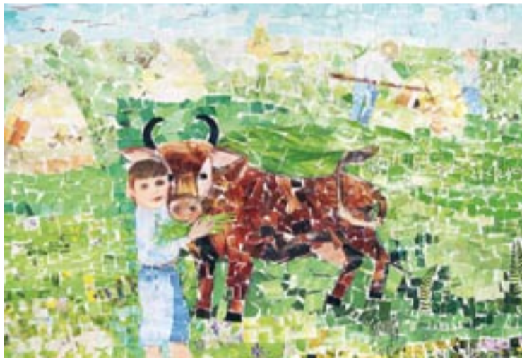
Доровська Тетяна, 12 років м. Шепетівка, Хмельницька обл.