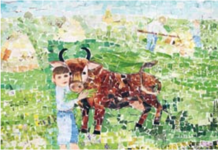
Доровська Тетяна, 12 років м. Шепетівка, Хмельницька обл.