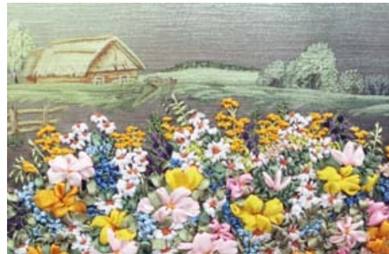
Дзюмка Юлія, 13 років м. Красилів, Хмельницька обл.