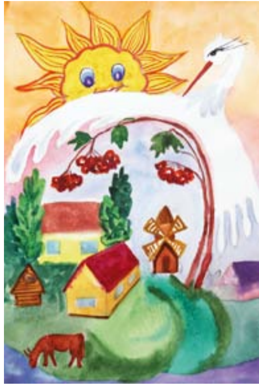
Козак Ірина, 13 років м. Красилів, Хмельницька обл.