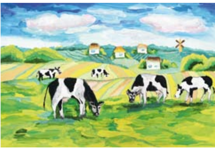
Макарик Анна-Марія, 13 років м. Нетішин, Хмельницька обл.